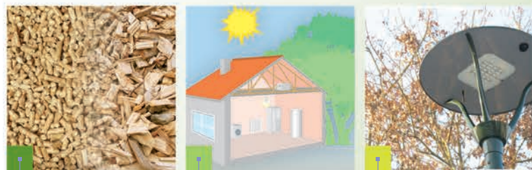
Produire une énergie renouvelable