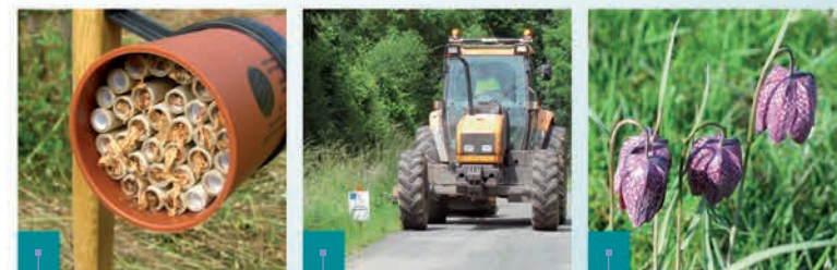
Un inventaire de l'existant